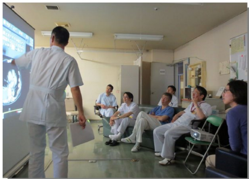
→CTカンファレンスの風景

『カンファレンス』(症例検討会)で重要な放射線診断学は、単純 X 線撮影・CT・核医学などの放射線を用いた検査法以外に、超音波など放射線を用いない画像検査も含まれており、画像診断学とも呼ばれます。画像診断技術の進歩は目覚ましいものがあり、実臨床において画像診断の果たす役割は極めて大きく、さらに日々発展しています。そのような画像検査の専門医が放射線診断医(画像診断医)で、『CTカンファレンス』では中心的役割を担っています。