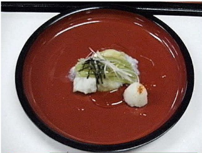
ひすい「鱈の翡翠蒸し」