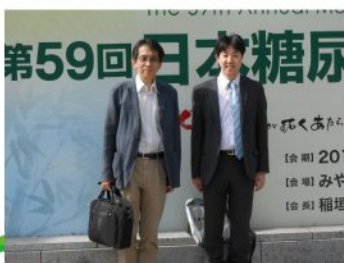
今回も優しく見守る垂水医師